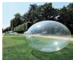
「酸素分子」(部分) 2011 フランス

自然環境を正常にもどすために自然に力を発揮してもらいます。その力のシンボルとして選ばれた「菜種」と「アマランサス」。2つの植物の「酸素分子」が創作の森の風景を一変させます。