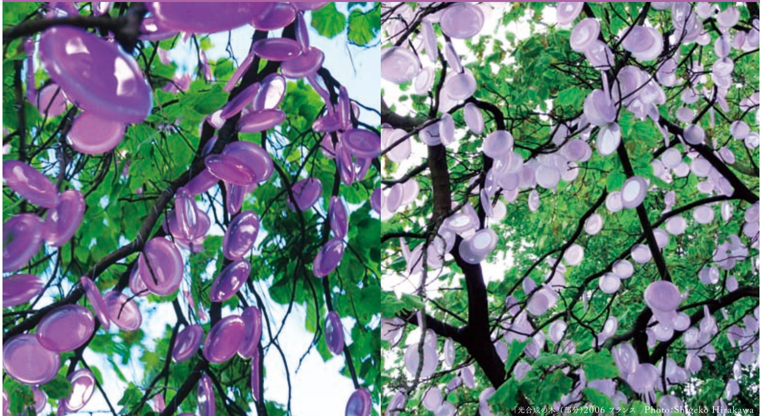
「光合成の木」(部分)2006 フランス Photo:Shigeko Hirakawa