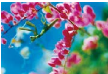
Acid Bloom | 2023