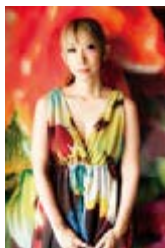
蜷川 実花【にながわみか】 | 写真家・映画監督

第26回木村伊兵衛写真賞【2001年】ほか数々受賞。2007年、映画『さくらん』監督。2008年、個展「蜷川実花展 地上の花、天上の色」が全国の美術館を巡回し、合計約18万人を動員。国内外での個展・グループ展多数。2010、Rizzoli N.Y.から写真集「MIKA NINAGAWA」を出版。世界各国で話題となる。2012年、映画『ヘルター・スケルター』監督。写真集「Acid Bloom」【2003年】、「FLOWER ADDICT」【2009年】、「桜」【2011年】など。その他、ミュージックビデオ、雑誌、広告など活動は多岐にわたる。