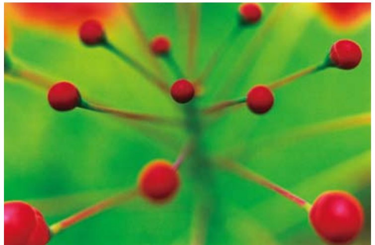
Acid Bloom | 2023

蜷川実花は艶やかで鮮烈な表現で独自の世界を確立し、国内外で活躍する現在最も注目されている写真家です。ファッションをはじめとする様々な分野のブランドなどとのコラボレーションで話題を集める一方、映画監督やミュージックビデオ等の映像でも成功をおさめるなど、その活動の幅は写真にとどまらず、ますます広がり続けています。本展は蜷川実花のレンズを通して、花や風景の儚い一瞬を切り取った作品の数々や映像作品によって、濃密な空間を創り出します。