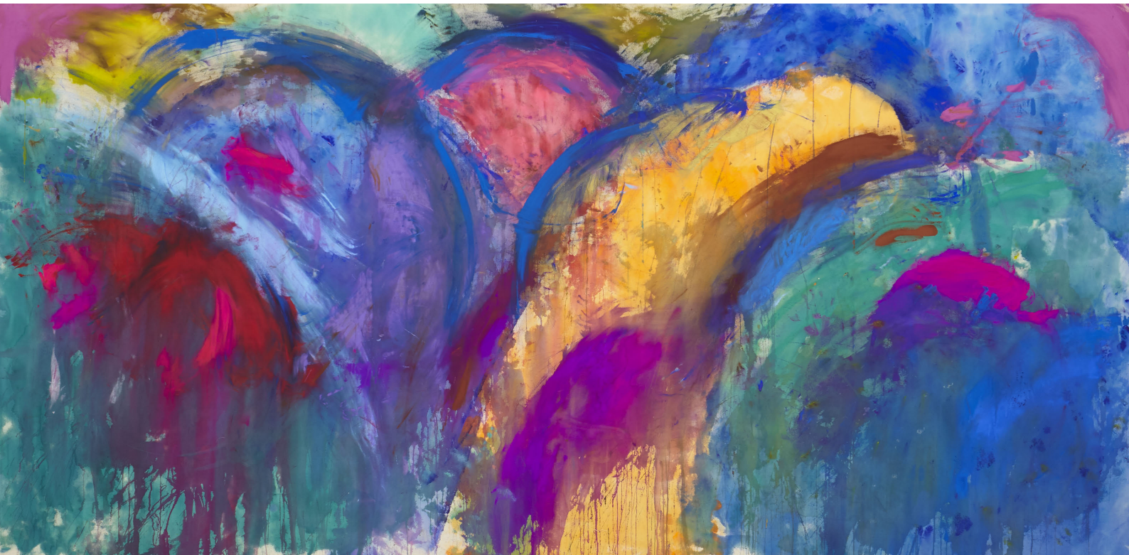
《岡山のお山のおはなし》Tale of mountain of Okayama 2015 photo by Kenji Takahashi © Ellie Oniya, courtesy of Tomio Koyama Gallery