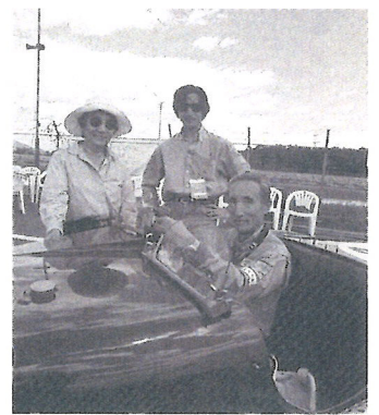
家族と愛車1928年ライレー・ブルックランズと共に

Profile | 1929年東京生まれ。自動車ジャーナリスト/自動車史研究者。1954年東京大学経済学部卒業。幼時より自動車を熱愛。学生時代から自動車ジャーナリストを目指し、1953年よりMotor Magazine誌に投稿する。1958-65年英国The Autocar日本通信員。1962年にCar Graphicを同志3人とともに創刊、1967-89年編集長を務める。現在二玄社Car Graphic編集顧問。著書に「小林彰太郎の世界」、「On the Roadすばらしきクルマの世界」他